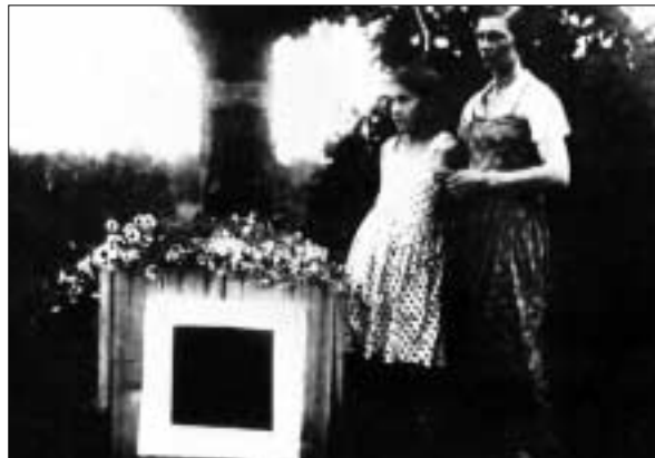
На могиле Малевича.

«В своих трактатах, – продолжает Гройс, – Малевич утверждает смерть иллюзорного мира традиционных культурных форм, смерть индивидуализированной «жизни». Их отрицание и символизируется «черным квадратом» – знаком «супрематии» внутреннего «ощущения» над внешней формой, подсознательного над сознательным, созерцания над волей, безличного над личным, хаоса над космосом, бесцельности над целью, чистой живописи над любым ее содержанием. «Черный квадрат» является знаком ничто, знаком космической смерти. Речь идет о предельной редукции (редукционизм есть тема всего авангарда, стремящегося к выявлению элементарного, нередуцируемого, неуничтожимого), но эта предельная редукция выступает в то же время как толстовское «опрошение»: она не изолирует от «элементарной» народной, внеиндивидуальной жизни, а, напротив, соединяет с нею. Поэтому для Малевича и оказывается возможным переход из этой точки предельного самоотрицания к новому проекту «общего дела», т.е. построению на месте внутренне полого иллюзорного мира европейской культурной традиции – нового мира, покоящегося на твердом основании предельно возможного умозрения, на ничто, на смерти, понятых как безличная жизнь народа по ту сторону любых индивидуальных стремлений или надежд».