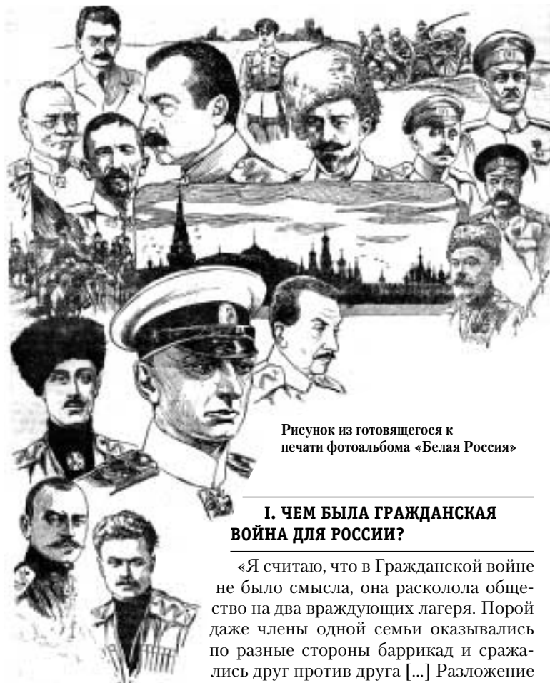
Рисунок из готовящегося к печати фотоальбома «Белая Россия»

В какой-то степени перед нами срез ценностных представлений той части молодежи, которая уверена в собственных силах, рассчитывает, в первую очередь, на жизненный успех, заинтересована в получении высшего образования и гуманитарном знании. Ее интересует прошлое, поскольку в нем она видит состояние настоящего и перспективы для будущего. Позиция тех, кто завтра придет в бизнес и политику, безусловно, представляет интерес. Потому что именно от выпускников начала XXI в. зависит, в конечном итоге, будущее России.